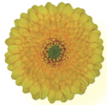
ファンタスティック