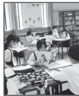
▲下広川小学校 授業風景

ため、姿勢よく学習している子どもの姿が印象的で、挙手する手は真っ直ぐに上げられています。