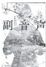
副音声 大林利江子 / 著 河出書房新社