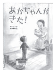
あかちゃんかきた! サトシン / 作 アリス館