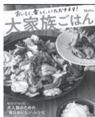
大家族ごはん Mako / 著 成美堂出版