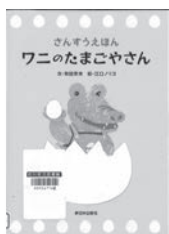
ワニのたまごやさん 有田奈央 / 文 新日本出版社