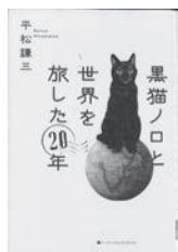
黒猫ノロと 世界を旅した20年 平松謙三 / 文・写真 ハーバーコリンス・ジャパン