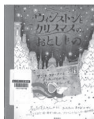
ウィンストンと クリスマスのおとしもの アレックス・T.スミス / 作 潮出版社