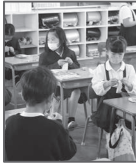
▲上広川小学校 授業風景

図書館教育に力を入れており、校内は読書に関する掲示物が多く見られました。どの学年も主体的で活発な学習が行われています。