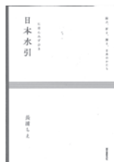
日本水引 長浦ちえ / 著 誠文堂新光社