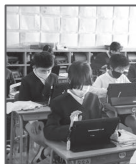
▲中広川小学校 授業風景

覚できる子供の育成」です。1時間の授業の中で、どのように理解したのかを振り返り、反復して学習することで、授業の質を高いものにする学習方法が採られていました。