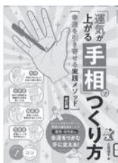
「運気が上がる手相」 のつくり方 北島禎子 / 著 メイツユニバーサルコンテンツ