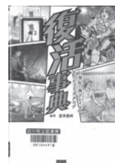
復活事典 造事務所 / 編著 カンゼン