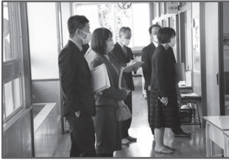
▲学校運営委員会 視察風景

広川町では、10月と11月に学校訪問を、11月8日(火)に学校運営協議会による学校視察を行いましたので、ご報告します。