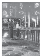
夢かうつつの雪魚堂 世津路章 / 著 マイクロマガジン社