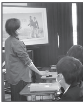
▲広川中学校 授業風景

重点目標は、「つながる・つなげる生徒の育成」です。あいさつの徹底が行われており、元気のよい生徒の声が校内に飛び交い、活気のある雰囲気が印象的でした。