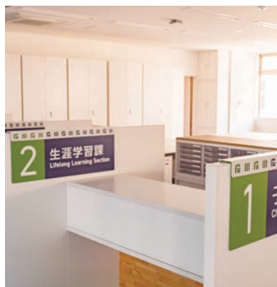
受付窓口には仕切りを設けることでプライバシーに配慮