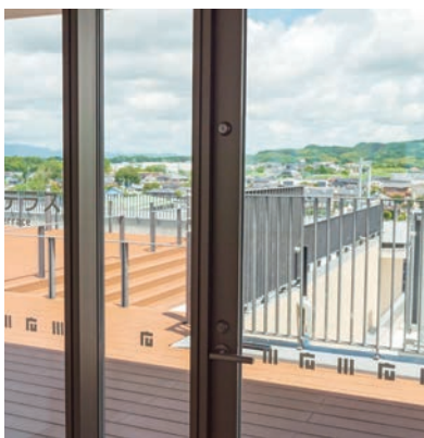
広川町を一望できる屋上階の展望スペース「ひろかわテラス」

広川町役場は、すべての町民の人のために存在します。広川町の発展のみならず、住みやすいまちを創造し、真に価値のある行政機関を目指します。