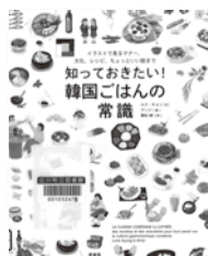
知っておきたい! 韓国ごはんの常識 ルナ・キョン / 文 原書房