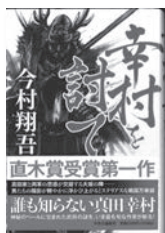
幸村を討て 今村翔吾 / 著 中央公論新社