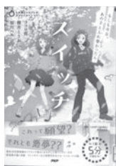
スイッチ ココロ直 / 著 PHP 研究所