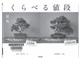
くらべる値段 おかべたかし / 文 東京書籍