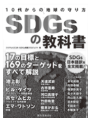
SDGsの教科書 フジテレビ CSR・SDGs 推進プロジェクト / 編 誠文堂新光社