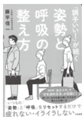
「調子いい!」が続く 姿勢と呼吸の整え方 藤平信一 / 著 大和書房