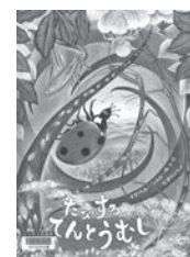
たびするてんとうむし イザベル・シムレール / 文・絵 岩波書店