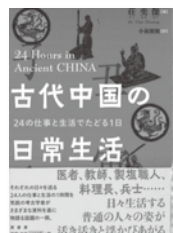
古代中国の日常生活 莊奕傑 / 著 原書房