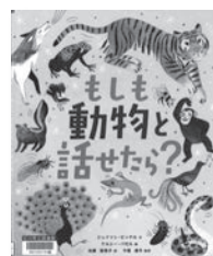
もしも動物と話したら? ジェイソン・ピッテル / 文 化学同人