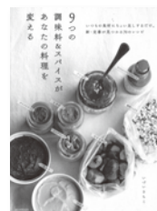
9つの調味料&スパイスが あなたの料理を変える いづいさちこ / 著 誠文堂新光社