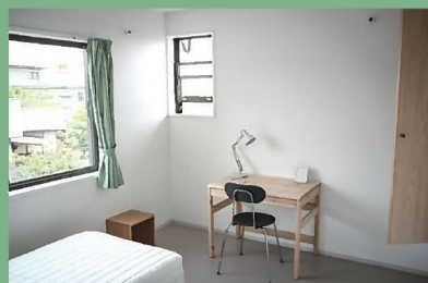
シングルルーム 3部屋