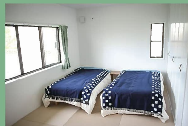
ツインルーム 1部屋