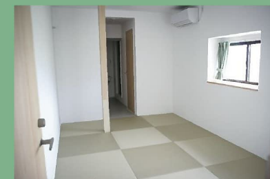
ファミリールーム 1部屋